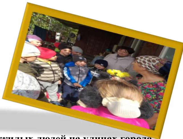
Поздравляли 1 октября пожилых людей на улицах города.